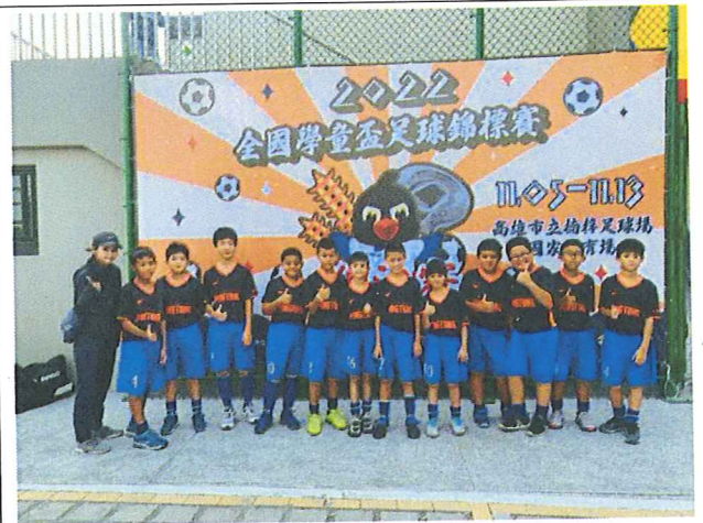
11 月 全國學童盃總決賽 16 強