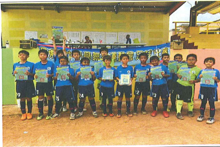
3 月 屏東縣中小聯運-季軍