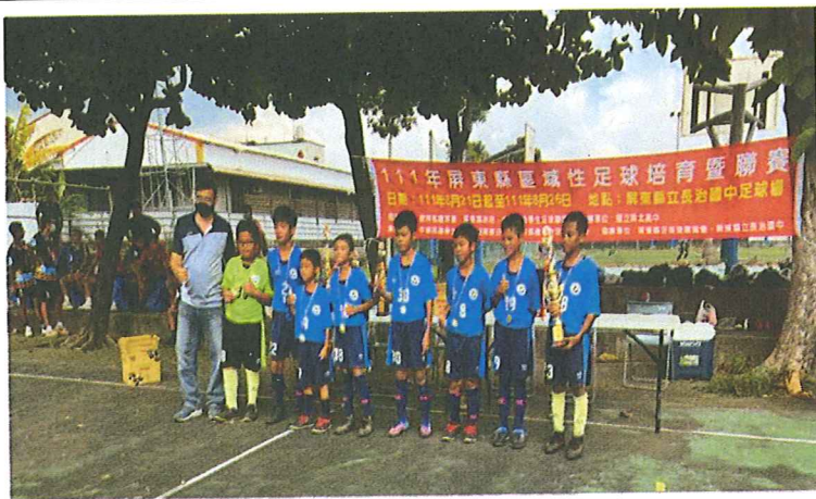
8 月 屏北區域性聯賽-盃賽冠軍