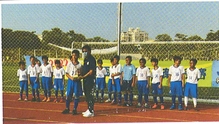
9 月 全國學童盃南區預賽-亞軍