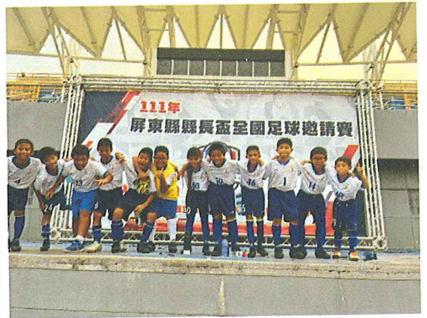
10 月 屏東縣縣長盃足球比賽